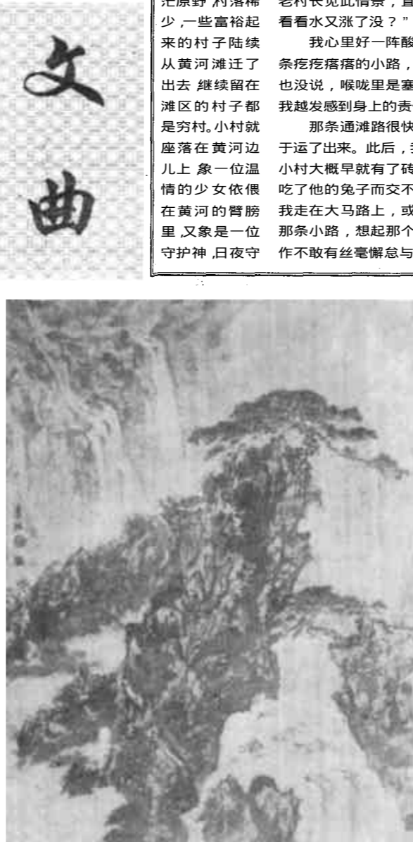
龙吟图 国画 / 李琳