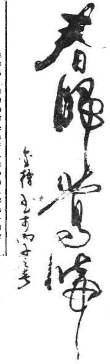
春归莺啼 书法 / 张金榜

阳光暖着，每一寸阳光里都有泥土的变化，它的有效成份在阳光里加重。一切生命都在这阳光的沐浴里。从那枝头的芽苞到种子的裂变，